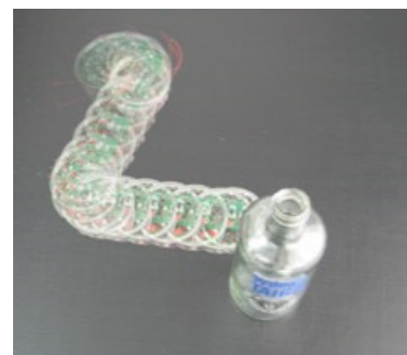
Der Bewegungsablauf des Roboters